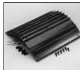
L4.83245.E Side extrusion right Rippenblech rechts