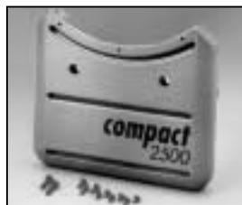
L4.83252.E Base casting, rear Wannenstirnteil, hinten