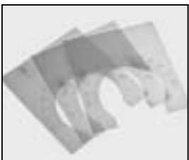
L4.73507.E Scale for justable stirrup Skala für Neigungsanzeige