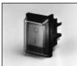
L4.72826.E On/Off switch Wippschalter