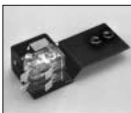
L4.73417.E Safety switch complete Einschalter komplett