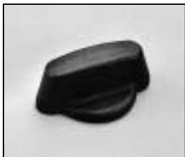
L4.81380.E Focus knob Fokusknopf