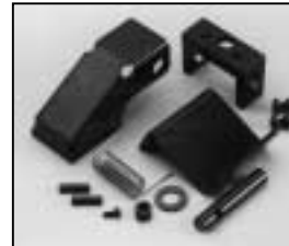
L4.74112.E Top latch man. Torsicherung man.