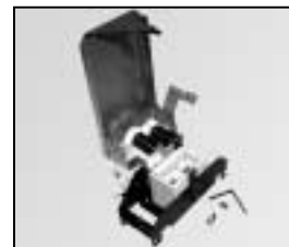
L4.83257.E Lampholder + lamp carriage Lampenfassung + Fokusschlitten old/alt to ser. no./bis Ser. Nr. 478 new/neu from ser. no./ab Ser. Nr. 479 please state serial no. on order bitte bei Bestellung Serien Nr. angeben