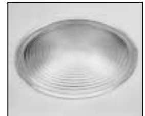
L4.83156.E Fresnel lens Stufenlinse