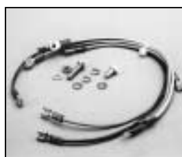
L4.73660.E Connecting wire Verbindungsdrähte