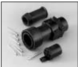
L4.75621.E Schaltbau connector (female) with coupling ring Schaltbau Stecker (Buchsenkontakt) mit Überwurfmutter