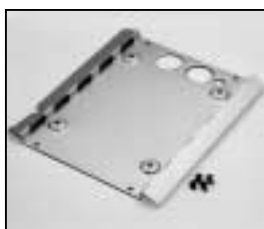
L4.73685.E Intermediate panel Zwischenblech