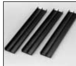
L4.83247.E Extrusions, top Rippenbleche oben