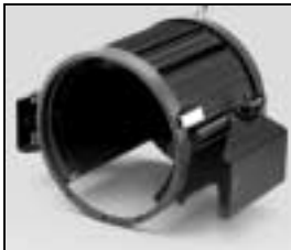
L4.83240.E Housing compl. Gehäuse kpl.

NOTE: WHEN ORDERING QUOTE PART NUMBER BEMERKUNG: BEI BESTELLUNG IDENT.-NR. ANGEBEN