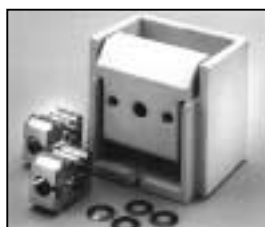
L4.73533.E Lampholder complete Lampenfassung komplett