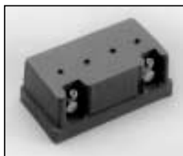
L4.83259.E Spark gap Funkenstrecke