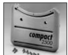
L4.83251.E Base casting, front Wannenstirnteil, vorne