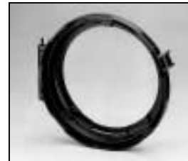
L4.83248.E Lens door Linsenfassung