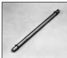
L4.83012.E Guide rail Leitspindel