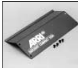
L4.83253.E Side panel left or right Seitenblech links oder rechts