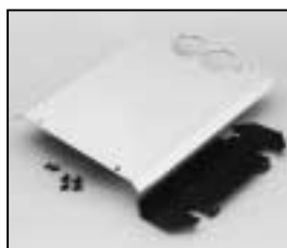
L4.83239.E Cover Abdeckblech