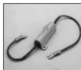
L4.73455.E Compensating resistance for electronic hour counter Vorwiderstand kpl. für elektr. Betriebsstundenzähler