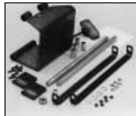
L4.83261.E Justable stirrup bracket set right f. motorized stirrup Schwerpunktverstellung rechts für motorisierte Bügel