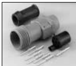
L4.75623.E Schaltbau connector (female) without coupling ring Schaltbau Stecker (Buchsenkontakt) ohne Überwurfmutter