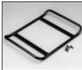
L4.73684.E Base skid Kufe