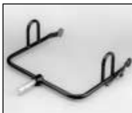
L4.83249.E Stirrup man. Haltebügel man.