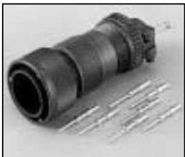
L4.75617.E Veam connector (female) Veam Stecker (Buchsenkontakt)