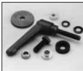
L4.83250.E Stirrup mounting set man. Bügelbefestigungs-Set man.