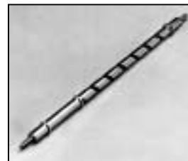
L4.83017.E Focus spindle man. Fokusspindel man.