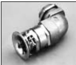
L4.73549.E Screw-type conduit fitting Kabelverschraubung