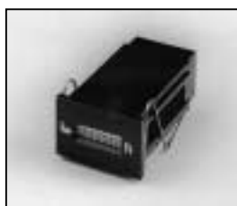
L4.77678.E Hour counter elec. Betriebsstundenzähler elek.