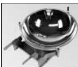
L4.80769.E Retrofit new reflectorholder + glass reflector to ser. no. 478 Umrüstsatz neuer Reflektorhalter + Glasreflektor bis Ser. Nr. 478