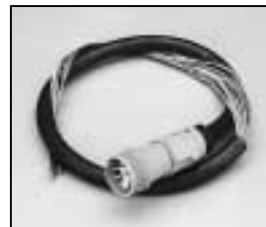
L4.73539.E Mains cable (Schaltbau)ARRI-norm without coupling ring Scheinwerferkabel (Schaltbau)ARRI-Norm ohne Überwurfmutter