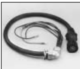
L4.75814.E Mains cable (Schaltbau) German TV-norm with coupling ring Scheinwerferkabel (Schaltbau) Deutsche Fernsehnorm mit Überwurfmutter