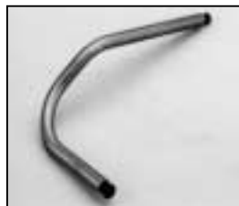
L4.73700.E Safety switch activator Drahtauslöser