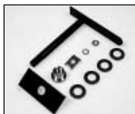
L4.73540.E Lamp lock shaft Hebel geschweißt