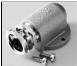
L4.73627.E Screw-type conduit fitting new Kabelverschraubung neu