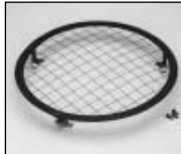
L4.83011.E Wire guard complete Schutzgitter komplett