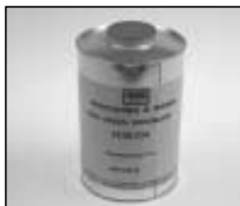
L4.70186.E Paint thinner Farb-Verdünnung