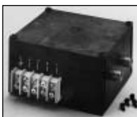
L4.83258.E Ignitor Zündgerät