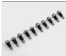
L4.80122.E 10 pcs. guid roll / focus 10 St. Führungsrollen / Fokus