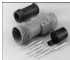
L4.75624.E Schaltbau connector (male) without coupling ring Schaltbau Stecker (Stiftkontakt) ohne Überwurfmutter