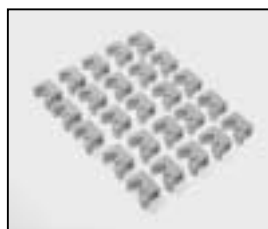
L4.80413.E 25 pcs. Ceramic holder-reflector 25 St. Keramikhalter-Reflektor