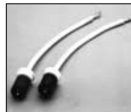
L4.73640.E H.T. cables complete Lampenkabel komplett