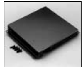
L4.83256.E Bottom panel Bodenblech