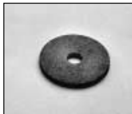
L4.83153.E Friction disc Friktionsscheibe