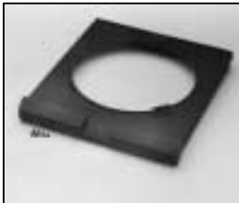
L4.73564.E slide in frame Einschubrahmen