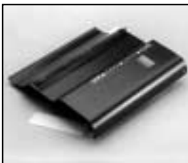
L4.83254.E Internal side baffle right Mantelstromblech rechts