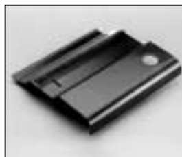
L4.83255.E Internal side baffle left Mantelstromblech links