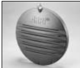
L4.83241.E Rear casting Rückteil