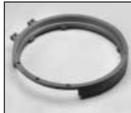
L4.83244.E Front casting Frontteil