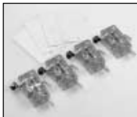
L4.72587.E 4 pcs. safety switch 4 St. Sicherheitsschalter