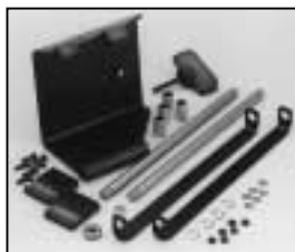
L4.83262.E Justable stirrup bracket set left f. motorized stirrup Schwerpunktverstellung links für motorisierte Bügel