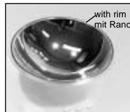
L4.80112.E New glass reflector from ser. no. 479 (does not fit into reflec- torholder to ser. no. 478 - in this case please order L4.80769.E) Glasreflektor neu ab Ser. Nr. 479 (passt nicht in Reflektorhalter bis Ser. Nr. 478 - in diesem Falle bitte L4.80769.E bestellen)