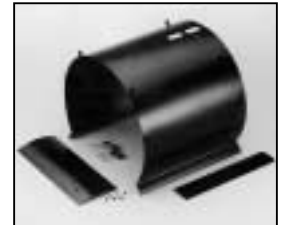
L4.74333.E Internal baffle Mantelstromblech