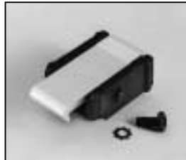
L4.79747.E Door catch set Schnapphaken-Set